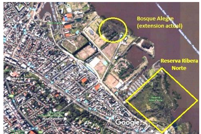
Ubicación de Bosque Alegre y Reserva Ambiental Ribera Norte, costa de San Isidro (marzo, 2016)

"...el C.A.S.I. se habría visto en la perentoria necesidad de expandir las posesiones que ya tiene en el Bajo de San Isidro a causa de la precipitada venta de unos terrenos que tenía en la localidad de Escobar. Además, y esto sí lo ha comunicado oficialmente el Club, la mudanza le permitiría reunir toda su actividad en San Isidro reforzando el valor simbólico de su pertenencia a esta comunidad." (Carta Abierta Asamblea Bosque Alegre).